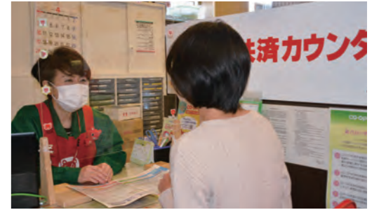
コープぜぜ店 共済カウンター